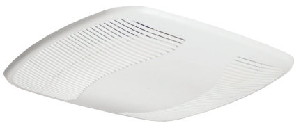
BRE-GR Grille avec luminaire intégré