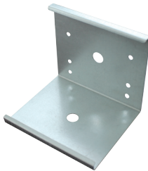
BRE-MC Support métallique pour montage rapide